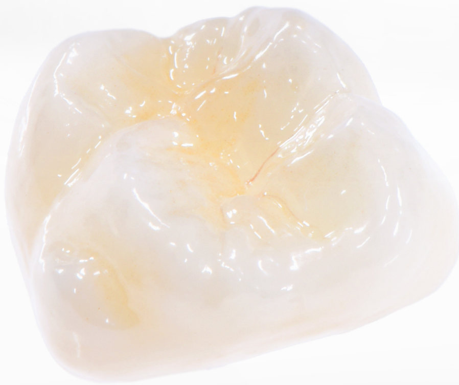
ステイニングによる特徴付け

実証済みであるチキソトロピー性のグレーズペーストで、1回の焼成で高い光沢の表現ができます。