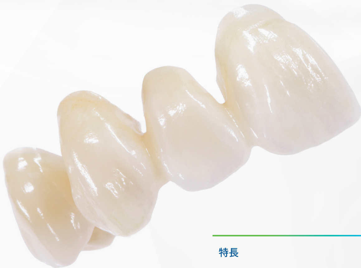
レイヤリングテクニック イボカラーで特徴付け

IPS イボカラーシェードペーストは、特にモノリシックな修復物のステインテクニックに適しています。