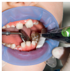
小児歯科の 修復治療