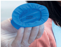
フレームの曲げやすさ