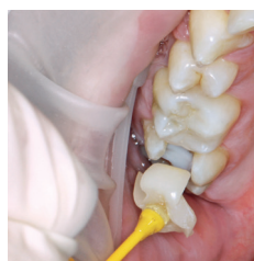
セメンテーション