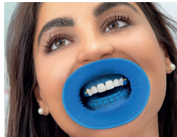
クランプなしで前歯の装着