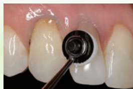
オプトラスカルプトパッドで成形