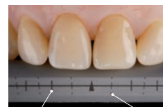
正面観歯冠幅径(実線) 歯軸傾斜(破線)